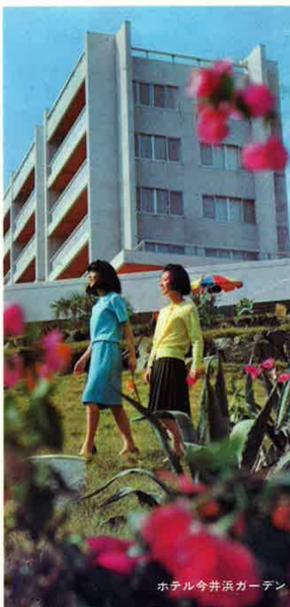
ホテル今井浜ガーデン